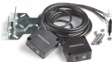
Фотоэлементы с рефлектором «Дамаст»