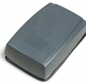
Приемник DMRE-2 внешний 2-х канальный