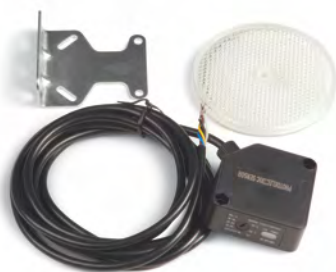
Фотоэлементы с рефлектором «Дамаст»