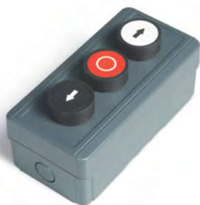
Пост управления трехпозиционный DB301 Damast