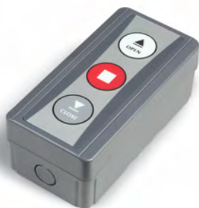
Пост управления трехпозиционный DB302 Damast