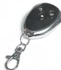
Пульт управления DM 433 МГц 4 кл. T15