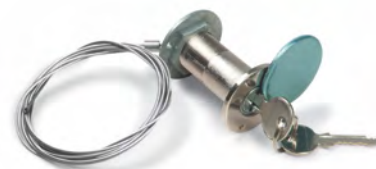
Внешний распепитель «Дамаст»