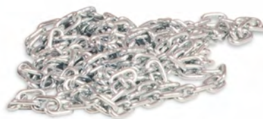
Цепь для привода