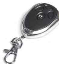
Пульт управления DM 433 МГц 4 кл. T01