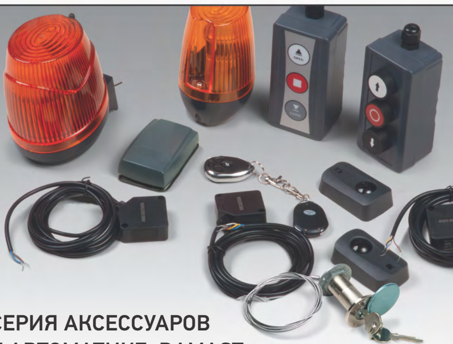
СЕРИЯ АКСЕССУАРОВ К АВТОМАТИКЕ «DAMAST»