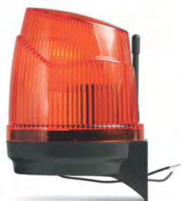
Сигнальная лампа с антенной